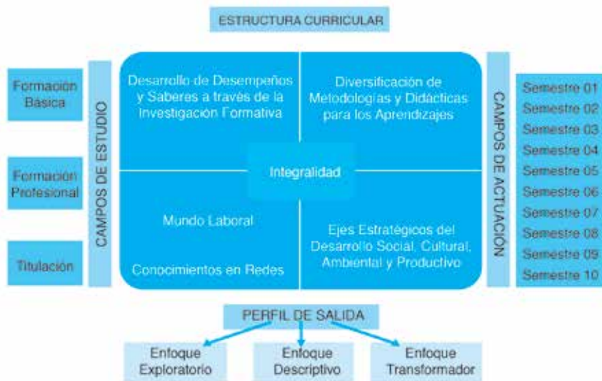
Figura 1. Estructura Curricular del rediseño de la carrera de Administración de Empresas.

La metodología utilizada en la presente investigación es mixta y de tipo aplicada, ya que la información se obtuvo de los diseños curriculares anteriores y en el desarrollo curricular del rediseño de la carrera de Administración de empresas. Los resultados obtenidos permitieron determinar la fuerza de asociación o correlación entre variables y la valoración por criterios de expertos y de